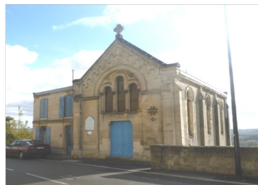
LAON : 4, rue de l'Arquebuse Culte à 10h30 les 1er et 3ème dimanches

Présidence CP : Dominique LANGLET 8, rue de Bretagne 02760 HOLNON Tél. : 0623698788 Trésorerie : Mariette SAUVAGE 8, rue des Jonquilles 02000 LAON Tél. : 0323203540 CCP : Eglise Protestante Unie des Disséminés de l'Aisne n° 15 16 48 K Châlons