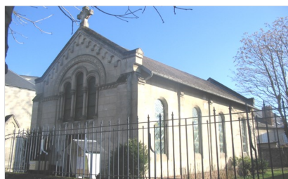
SOISSONS : 4, bd Gambetta Culte à 11h les 2ème et 4ème dimanches

Site internet : http://www.erf-aisne2.fr/ Compte Facebook : @EPUAISNE2